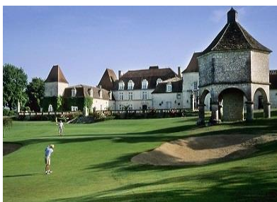
Descubra los chateaux franceses y juegue al golf en su viaje a Paris.