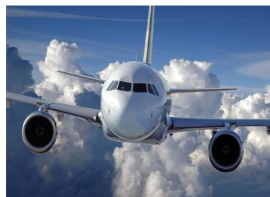
Si lo desea, le gestionamos sus billetes de avión.