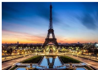
Prolongue su estancia en Paris y disfrute de la ciudad de las luces.